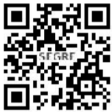
◀▶ 'Coeficients de fricció' (2016).