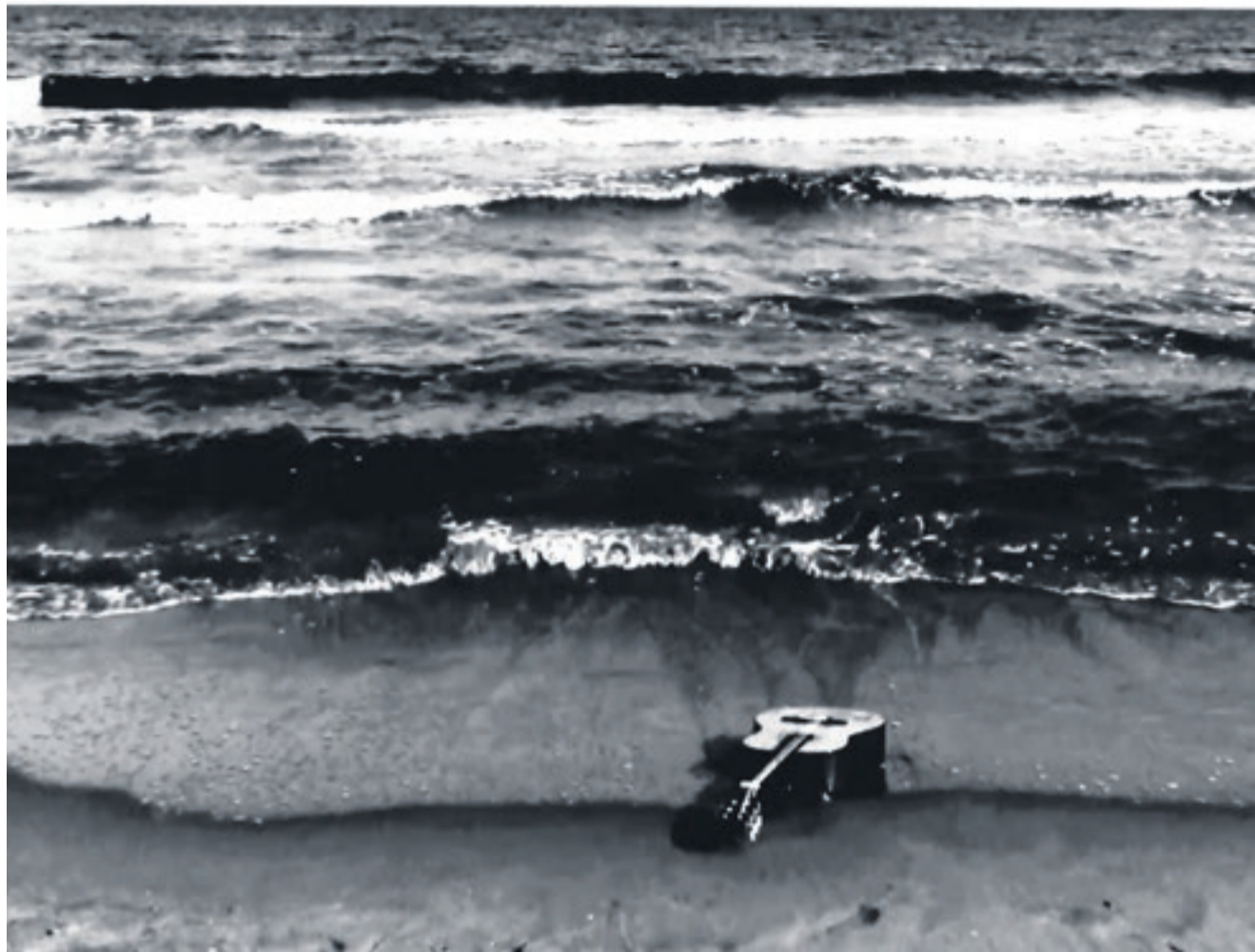
'Coeficients de fricció' (2016). Intervencions als espais naturals del delta de l'Ebre, enregistrant el so de la fricció de l'aigua, sorra, ones...

Però no ens equivoquem. La pèrdua de valor estrictament musical de bona part de les músiques que es fan avui és la part negativa d'un món que té moltes coses positives. A Twitter es llegeix poesia d'un nivell infim, sí, però es llegeix més versos que mai. La música està present en la vida de tothom com mai no ho havia estat. Una simfonia de Mozart només la sentien quatre aristòcrates en un món repugnantment classista, elitista i excloent. Avui de la música en gaudim tots. I quan la marca Rosalía es menja la música Rosalía i ens tortura amb un reggaeton, sempre podem obrir YouTube i admirar la seva Alfonsina y el mar , una cosa que probablement faran algunes persones que hauran conegut aquesta bona creadora a partir de l'infame reggaeton. ■