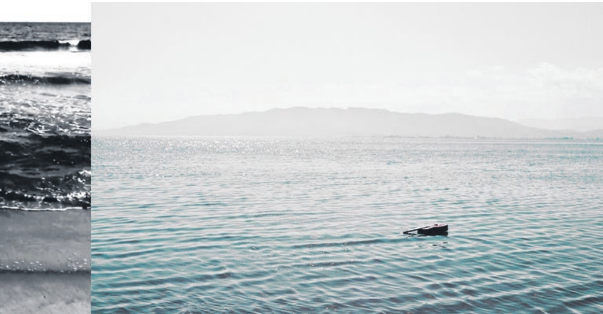
Obre una antiga guitarra Telesforo Julve de vuitanta anys d'antiguitat.

(Llotja, Enric Granados, Barris Nord, Basses d'Alpicat...) a medio o nulo gas y con programaciones que también han sufrido falta parcial de apoyo institucional amén de haber sido objeto de eventual lucha política.