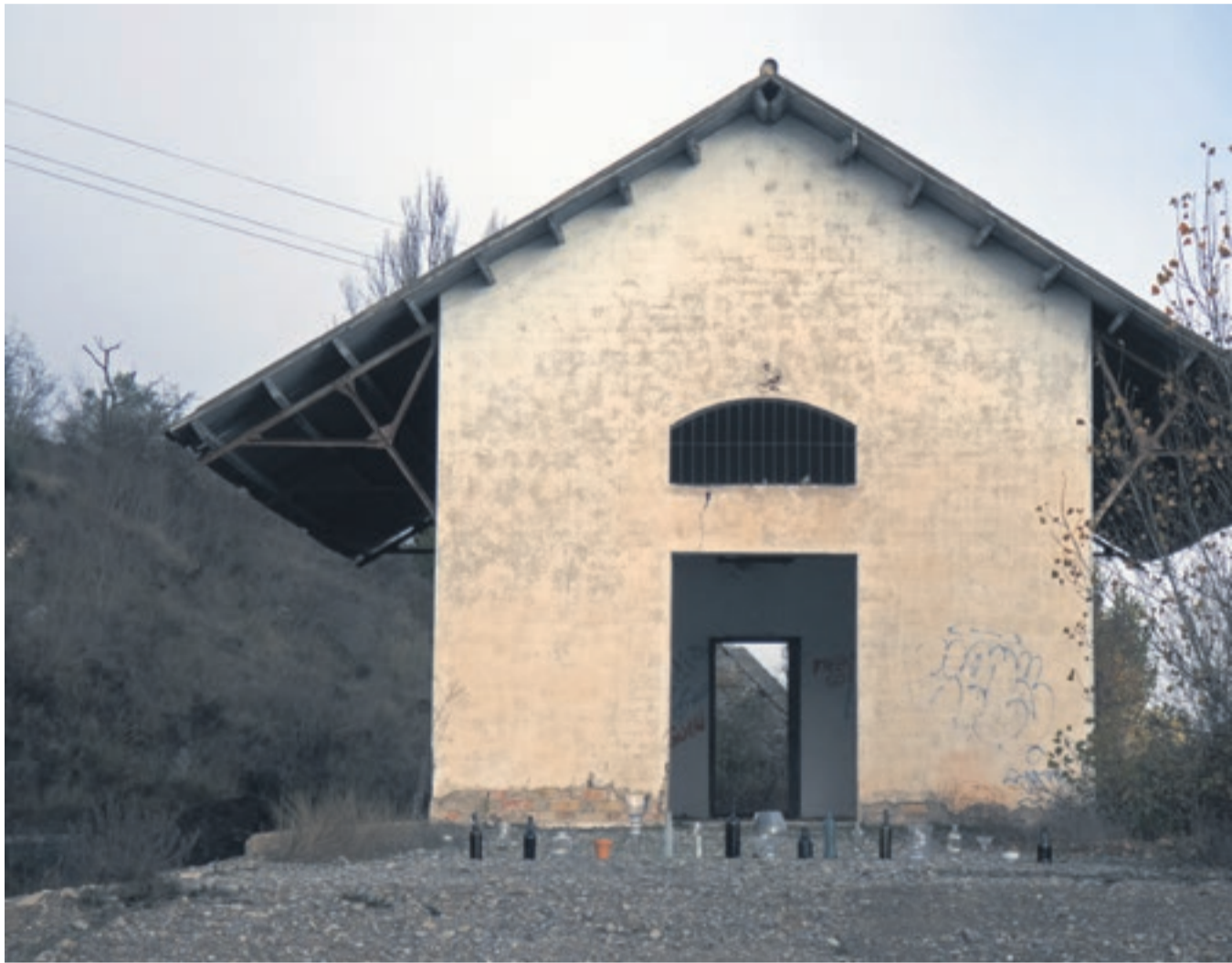
'21 Ruidos para la Nostalgia' (2019). Projecte presentat a l'Espai Guinovart entre el gener i el maig del 2019.

tat d'un coratjós treball hermenèutic, textual i arxitextual, comporta moltes renúncies, també ho és que la mostra antològica permet observar, mitjançant una operació dialògica inherent a la mateixa lectura de textos, l'evolució, els desplaçaments, la continuïtat o les oposicions ideològiques i estètiques entre els diferents creadors. Aquesta és indubtablement l'aportació crítica més significativa que obtindrà el lector d'aquest repertori de textos, precedits