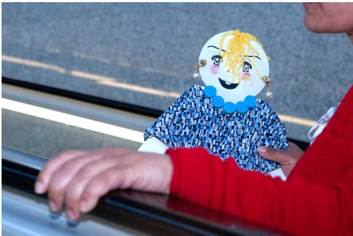
Derives Urbanes. Taller a càrrec de Francesc Ruiz

Nova publicació Derives urbanes , fotocòmic realitzat a partir del taller organitzat el mes de juny passat pel Centre d'Art la Panera a càrrec de l'artista Francesc Ruiz