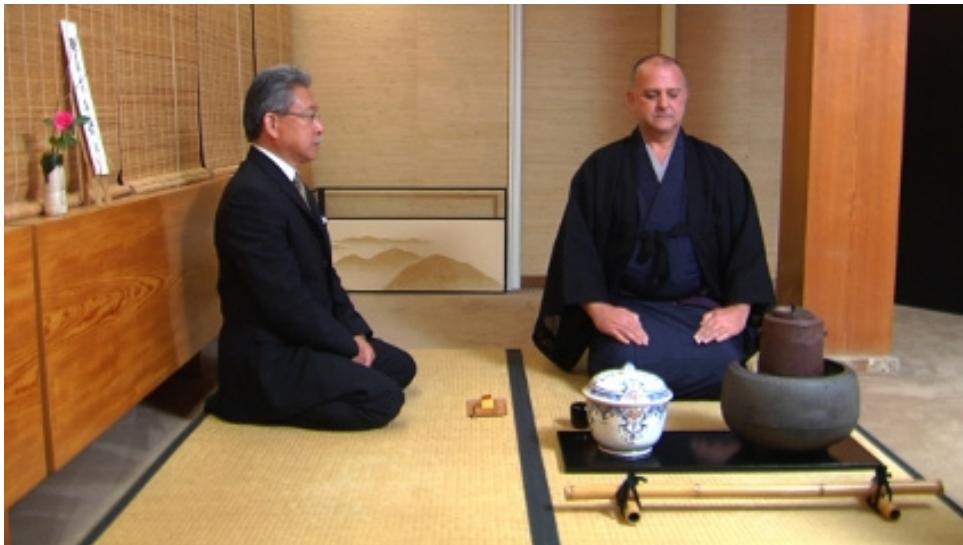
Un encuentro perfecto , 2007

Un encuentro perfecto presenta, amb una riquesa visual de plans generals i primers plans magnífica, una cerimònia del te típicament japonesa però conduïda per un mestre de te espanyol i seguida per un convidat japonès resident a Espanya. De nou, una mostra de mestissatge cultural, que genera una certa sensació d'estranyesa, però que acaba atrapant l'espectador en una posada en escena de gran bellesa visual.