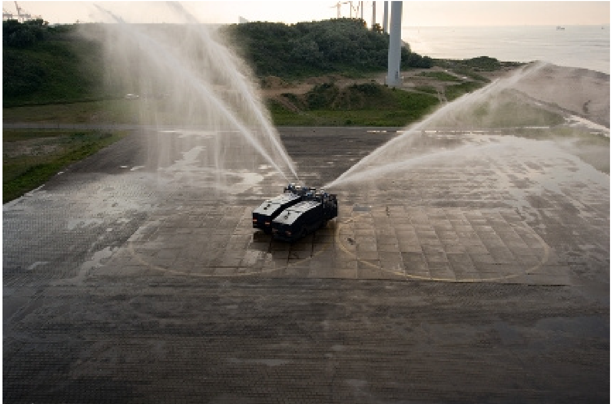
Fernando Sánchez Castillo. Pegasus Dance, 2009

Tot seguint la línia iniciada l'any 1997, la Biennial reuneix una sèrie d'artistes catalans i espanyols per tal d'oferir un panorama diversificat de la situació de les arts visuals al nostre país i amb la voluntat de seguir mostrant treballs que han escollit moure's en zones frontereres entre l'art, l'arquitectura i el disseny. Així mateix, hi haurà un important apartat dedicat als llibres d'artista i publicacions especials.