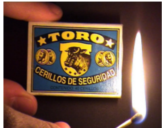
Folklore #2, 2008