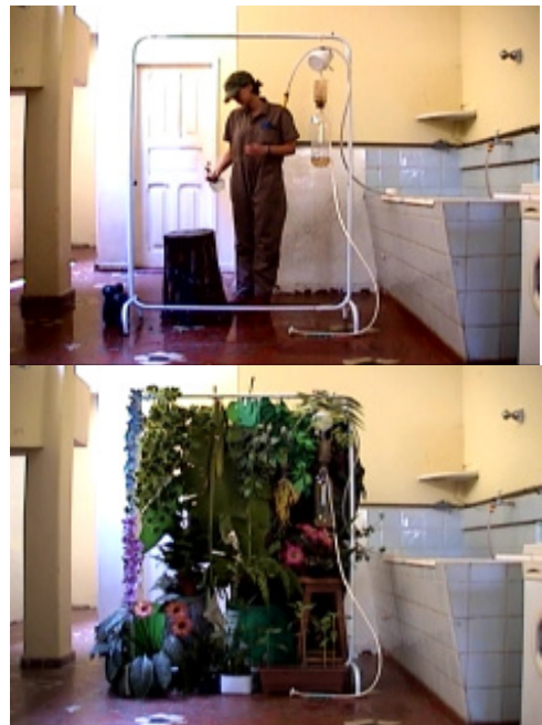
Selva-me (Jungle me) , 2003