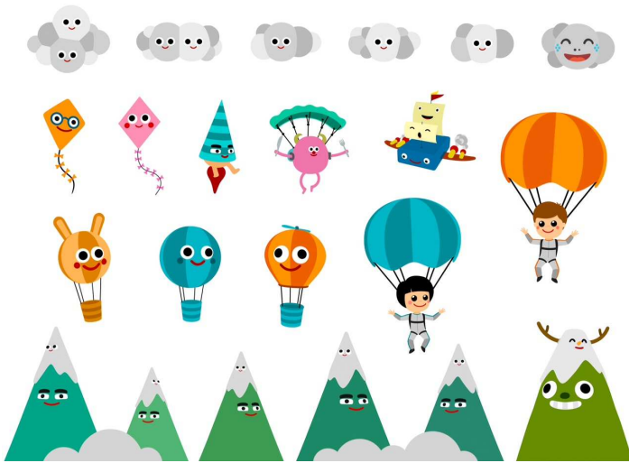
ELEMENTS DEL CEL