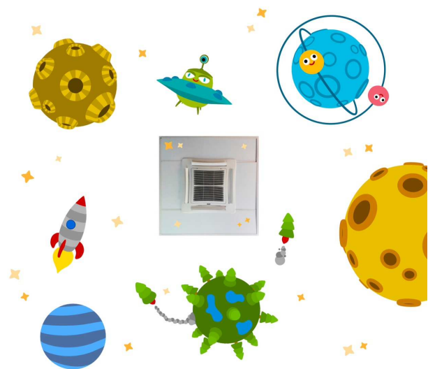
ELEMENTS DE L'ESPAI

L'autor amb aquesta obra té clara voluntat d'humanització de l'espai hospitalari per tal de transformar-lo en quelcom que ajudi a disminuir els nivells d'estrés que poden ocasionar les circumstàncies de ser infant o familiar i estar a l'hospital.