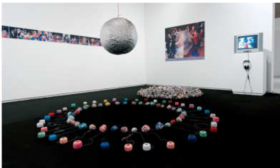
Projecte «Vaivé», 2011. Jornada de Portes Obertes, centre d'art la Panera, 2011. (Escuela Infantil Zaleo, Escola Bressol Municipal de Cappont i Javier Abad) EXPOSICIÓ TREBALLADA: «UN(INVERSE)», DE TXUSPO POYO

El projecte «Vaivé» neix a partir de l'obra Full time , present a l'exposició «UN (INVERSE)», de Txuspo Poyo. Un gran pèndol, en moviment oscil·latori continu, proposa una metàfora que té connotacions amb l'esdevenir i, per tant, amb l'educació com a espai de vida . Així, escola i centre d'art són llocs privilegiats per al coneixement, la percepció i les relacions d'intercanvi, que s'organitzen com un «balanceig» o ritme constant d'alternances entre el flux i el reflux, el teu – el meu, aquí-ara, aprendre-desaprendre, etc. Aquest flux de processos són les coreografies que organitzen i donen significat a les nostres vides. Aquesta representació a la Panera com a espai simbòlic invita a realitzar un joc mitjançant accions que van i vénen d'una escola a l'altra, de l'escola al centre d'art i d'aquest a altres possibles llocs que el visitant vulgui compartir.