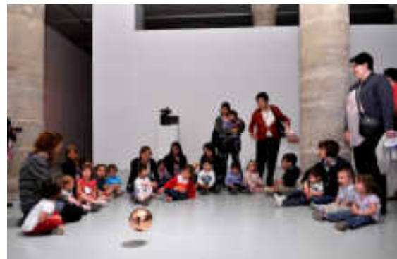
Visita al Centre d'art La Panera. EBM Magraners i EBM Llúvia.