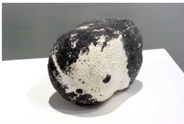
Patricia Dauder, Cap negre , 2003 Colección de arte contemporáneo del Ajuntament de Lleida

La misma artista ha elaborado una disposición para este conjunto de obras, que una vez situado y distribuido en el espacio expositivo, deja entrever lo que la artista denomina cadencias o ritmos: "lo que para mí es una cadencia de mayor o menor intensidad, se expresa por la materialidad o inmaterialidad, o por una presencia penetrante o por una ausencia, o por la dispersión, o por la nada. Se trata de conceptos duales que muy a menudo han acompañado mi obra".