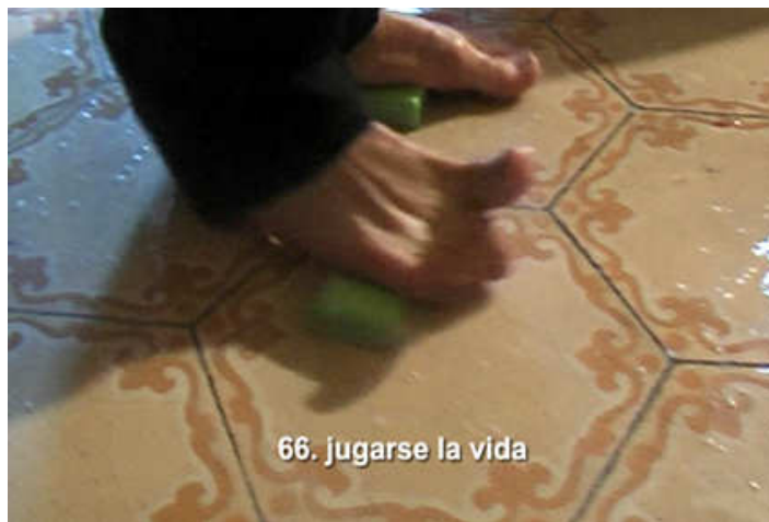
David Bestué / Marc Vives, Acciones en casa , 2005 Colección de arte contemporáneo del Ajuntament de Lleida

Este vídeo recoge uno de los tres capítulos dedicados a las series de acciones realizadas por estos artistas: Acciones en Mataró , Acciones en el cuerpo y esta Acciones en casa , que reúne cerca de un centenar de pequeñas acciones, realizadas por los artistas, que transcurren en el mismo ámbito doméstico. Se trata de un espacio aparentemente anodino, en el que actúan de forma espontánea, con rápidas intervenciones que son fruto del azar y que arrancan una inevitable sonrisa nerviosa, aquélla que suele surgir del desconcierto. Las acciones nos remiten a las de Bruce Nauman midiendo su propio cuerpo con el espacio arquitectónico de su estudio, o a las de Fischli & Weiss usando toda suerte de objetos y materiales en un largo encadenado de reacciones físicas y químicas. Se trata de relecturas artísticas en clave irónica, que recurren a la futilidad de lo cotidiano para construir ficciones y que evitan el peso artístico de la experiencia vital.