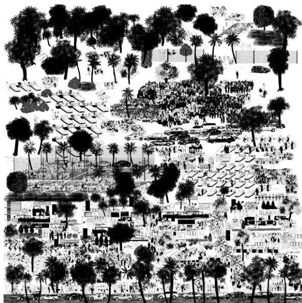
Francesc Ruiz, Zona Alta, 2006 Colección de arte contemporáneo del Ajuntament de Lleida

Con Zona alta ofrece una visión de la parte alta de Barcelona, en la que descubrimos su paisaje urbano y unos indicios que nos revelan las costumbres de sus habitantes, con un especial énfasis en lo que en ella sucede cuando cae la noche. A buen seguro que un conocedor de esta zona reconocerá los sitios y los hábitos que la significan como una zona acomodada, a la vez que descubrirá también en ella el sentido crítico y humorístico del artista.