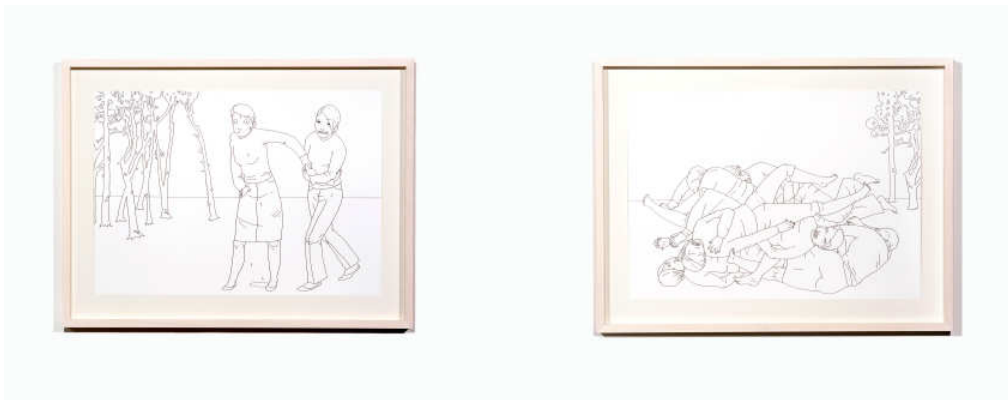
Abigail Lazkoz, Comadre que suda y 2001 La misma piel , 2001 Colección de arte contemporáneo del Ajuntament de Lleida.

Sus trabajos retoman el dibujo para reflexionar sobre hechos y situaciones que dotan de un marcado carácter narrativo que deja entrever una estética, cercana a lo siniestro. La cuidada representación de la gestualidad y la expresión de sus personajes contribuye a la realización de escenas casi teatrales, que activan en nosotros la capacidad de imaginar posibles causas, nudos y desenlaces. Consciente de la relación directa con el lenguaje del cómic, la artista reconoce influencias del expresionismo, el surrealismo y otros tan diferentes como los grabadores japoneses o mejicanos, el manga o cineastas como Tim Burton. Abigail Lazkoz, técnicamente, además de trabajar la ilustración sobre papel también acostumbra a trasladar los dibujos sobre el muro y a gran formato.