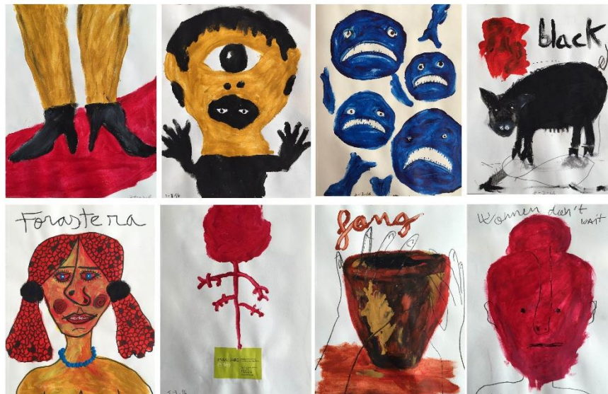
Dibuixos del 17 al 24 ordenats de esquerra a dreta