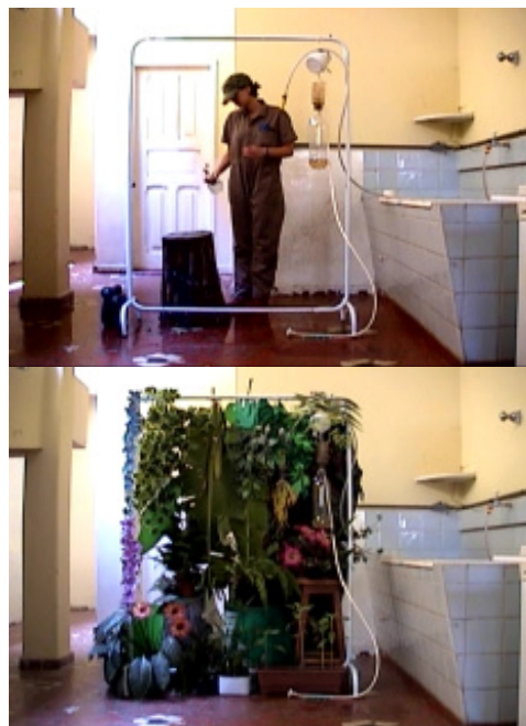
Selva-me (Jungle me) , 2003