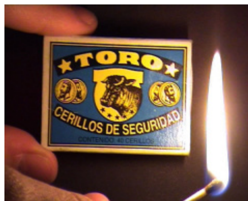
Folklore #2 , 2008