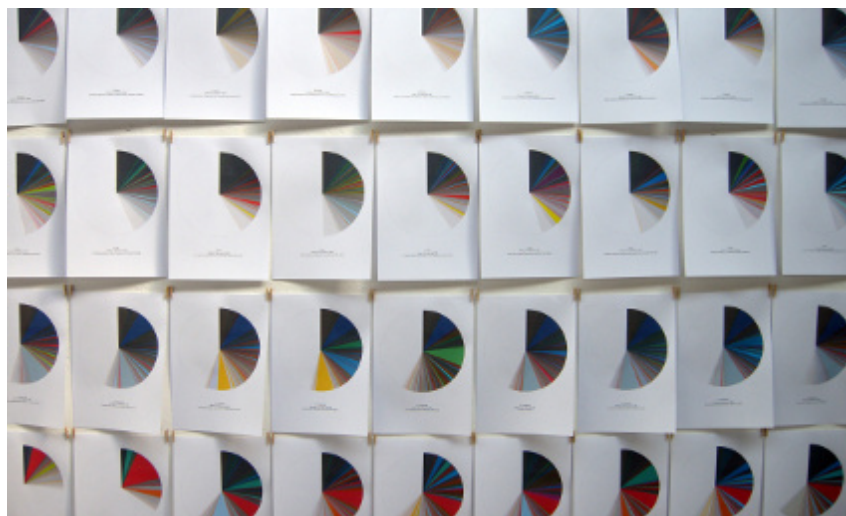
Frecuencia cromática en prensa escrita española de enero de 2008 , 2008

Este artista define su trabajo como «pequeñas acciones que buscan sacar a colación la subjetividad que hay en las cosas que creemos objetivas. Parte de procedimientos estandarizados y modifica ligeramente su funcionamiento para llevar sus resultados al absurdo». Estas palabras nos introducen en un proyecto artístico muy particular, cuya base es un sólido conocimiento digital y unas pautas de actuación sistemáticas, obstinadas, incluso obsesivas, para desarrollar métodos de trabajo susceptibles de ofrecer miradas diferentes sobre el entorno más inmediato; una mirada que a menudo deja entrever un cierto toque de ironía, crítico y quizás cada vez más ácido, como él mismo reconoce. Y este aspecto lo podemos observar en el proyecto «Frecuencia cromática en prensa escrita española de enero de 2008», para el que analizó las portadas de cuatro periódicos españoles diariamente durante el mes de enero de 2008 ( El Mundo , El País , El Periódico de Catalunya y La Vanguardia ) mediante una aplicación informática que genera 120 gráficos que muestran la frecuencia con la que aparecen los 64 colores predominantes en las portadas. El análisis que extrae es que podía existir un cierto «color de las noticias», dado que se intuía que determinada gama de colores estaba relacionada con cierta política del periódico.