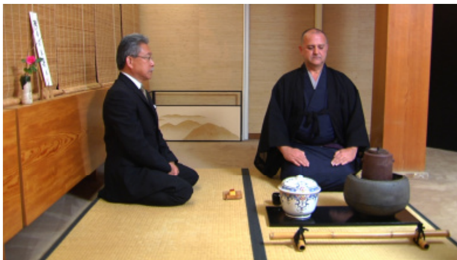
Un encuentro perfecto, 2007

Un encuentro perfecto presenta, con una riqueza visual de planos generales y primeros planos magnífica, una ceremonia del té típicamente japonesa pero conducida por un maestro de té español y seguida por un invitado japonés residente en España. De nuevo, una muestra de mestizaje cultural, que genera una cierta sensación de extrañeza, pero que acaba atrapando al espectador en una puesta en escena de gran belleza visual.