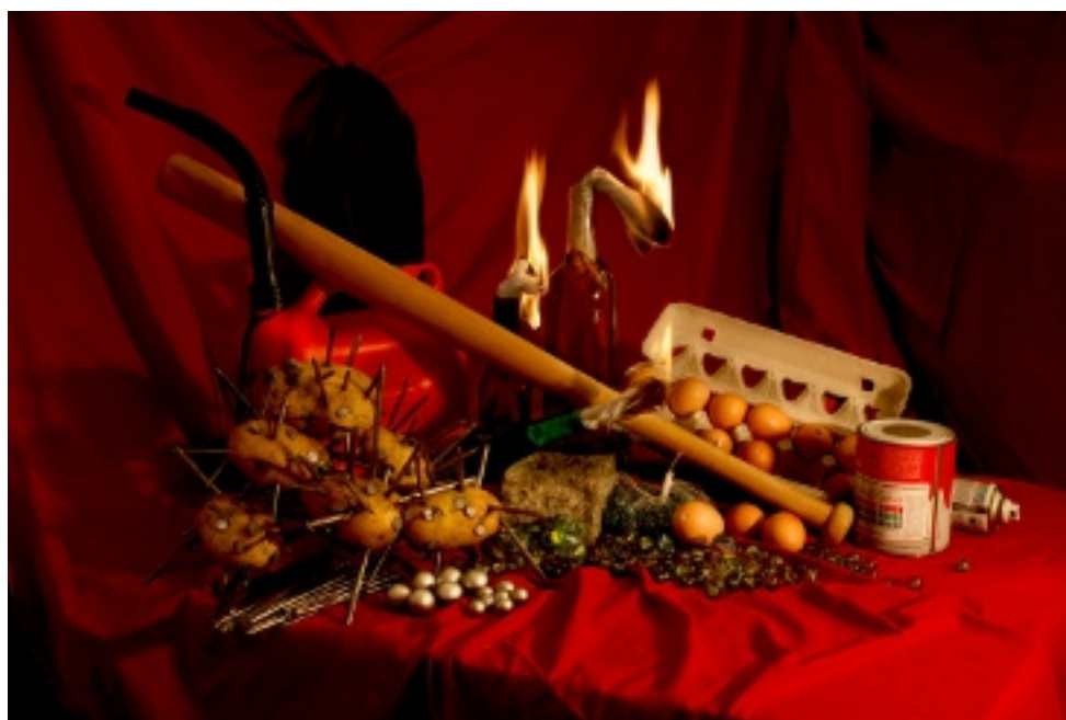
Bodegón , 2009