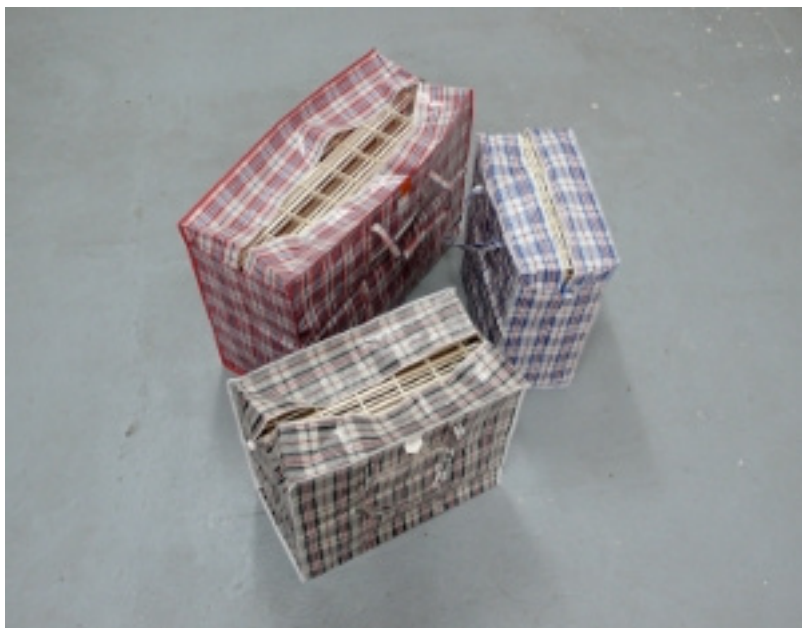
S, M, L multi-purpose bags , 2009

3 bolsas de plástico y madera de balsa 55 x 74 x 30 cm – 47 x 54 x 28 cm – 52 x 44 x 23 cm