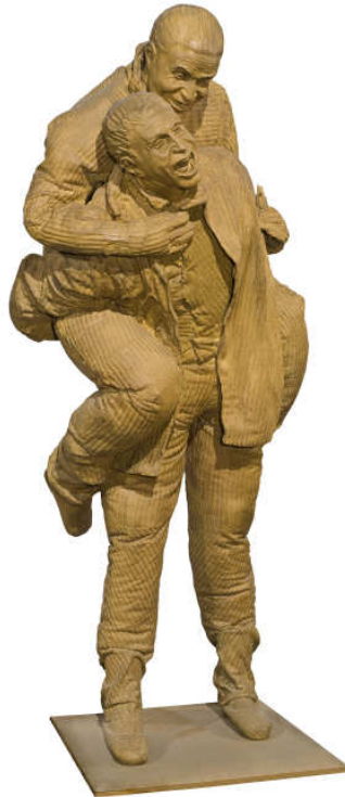
Juan Muñoz, Piggyback sequence of 4 , 2001 (detall) Col·lecció Fundació Sorigué

Els quatre doble personatges d'aquesta instal·lació insinuen, a més del fet recurrent de la incomunicació, una certa dosi d'humor, que no deixa de ser un nou element desestabilitzador per a l'espectador que deambula per les seves escenografies.