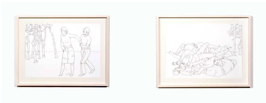
Abigail Lazkoz, Comadre que suda , 2001 y La misma piel , 2001 Col·lecció d'Art Contemporani de l'Ajuntament de Lleida.

Els seus treballs reprenen el dibuix per reflexionar sobre fets i situacions que dota d'un marcat caràcter narratiu que deixa entreveure una estètica, propera a allò sinistre. L'acurada representació de la gestualitat i l'expressió dels seus personatges contribueix a la realització d'escenes gairebé teatrals, que activen en nosaltres la capacitat d'imaginar possibles causes, nusos i desenllaços. Conscient de la relació directa amb el llenguatge del còmic, l'artista reconeix influències de l'expressionisme, el surrealisme i d'altres tant diferents com els gravadors japonesos i mexicans, el manga o cineastes com Tim Burton. Abi Lazkoz, tècnicament, a més a més de treballar la il·lustració sobre paper també acostuma a traslladar els seus dibuixos sobre el mur i a gran format.