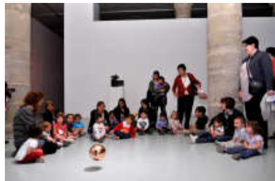
Visita al Centro de arte la Panera. EBM Magraners y EBM Llivia.