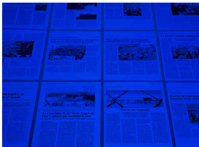
Octavi Comeron, Blue – Collar Suite no.2 : Lear's song, 2009