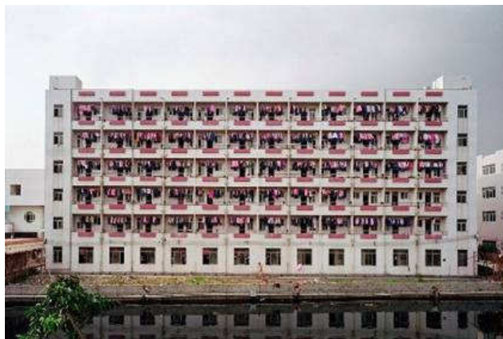
Edward Burtynsky. Manufacturing #4, 2005 Galeria Toni Tàpies, Barcelona