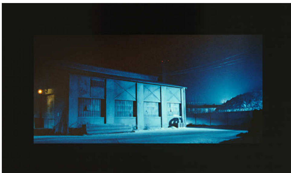
Oliver Boberg. Factory site, 2002 Galeríe Lothar Albrecht, Frankfurt

En la serie Nacht-Orte (Lugares nocturnos) se encuentra Factory Site , un cortometraje que consiste en un encuadre fijo del exterior de una fábrica, de la que no sabemos el nombre, ni dónde está ubicada, ni qué produce, a pesar de terminar conteniendo todas las fábricas. Se trata de una imagen particular que se convierte en universal.