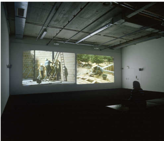
Harun Farocki. Comparison Via a Third , 2007 Galeria dels Àngels, Barcelona.

Su dilatada trayectoria siempre ha estado vinculada al cine, hasta el punto que ha dirigido más de un centenar de largometrajes, documentales, películas de ensayo y videoinstalaciones. Su obra es una de las más sofisticadas, originales y complejas del cine alemán moderno. Según Gilles Deleuze, podemos llamar a sus filmes como "ensayos de clasificación de imágenes", dado que desarrolla una especie de ordenación de las imágenes con la voluntad de descubrir la ideología subyacente a la técnica, o la manera como esta técnica es capaz de generar nuevas estructuras de pensamiento. El tema de Comparison via a Third es el trabajo en las fábricas de ladrillos. Farocki muestra cómo se realiza la producción de este material para la construcción en tres modelos de sociedad distintos: la tradicional, la que se encuentra en vías de industrialización y la plenamente industrializada. La simple yuxtaposición a partir de continuos saltos espaciotemporales nos expone a diferentes realidades que desconocemos –ya sea por la comodidad propiciada por el bienestar del primer mundo o por la ignorancia–, y nos hace tomar consciencia que en un mismo momento histórico la realización de un mismo trabajo se puede ejecutar de acuerdo con regímenes de semiesclavitud o con tecnologías que han arrinconado la presencia humana. Son, por lo tanto, realidades diferentes que sólo se explican por las grandes desigualdades económicas que las separan.