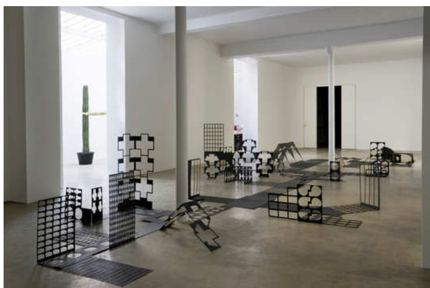
Jennifer Allora & Guillermo Calzadilla, Ruin , 2006 Galerie Chantal Croussel, París

Las ideas de transformación y resignificación estaban presentes en la exposición "En(Tropics)" (Galerie Chantal Croussel, París, 2006), donde se presentó por primera vez Ruin . El concepto que vertebraba la muestra era el principio de entropía, que implica que los sistemas próximos están expuestos inevitablemente a un proceso de disolución y de neutralización en el tiempo.