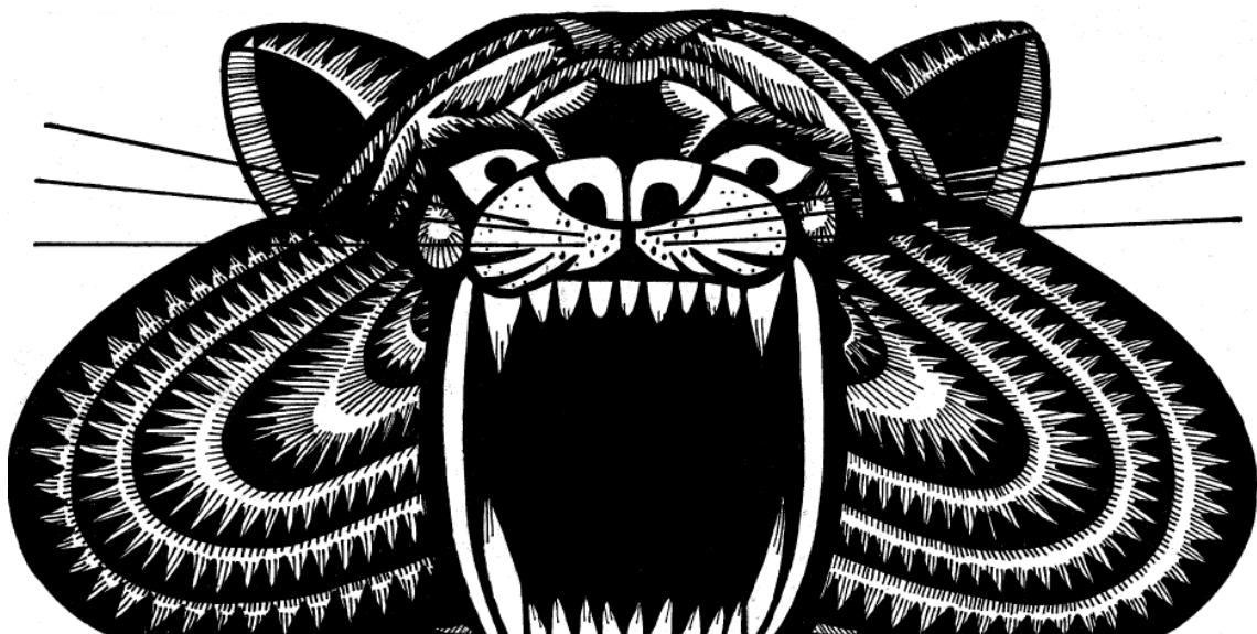
Abigail Lazkoz, Fiera negra , 2007 (detall dibuix instal·lació)