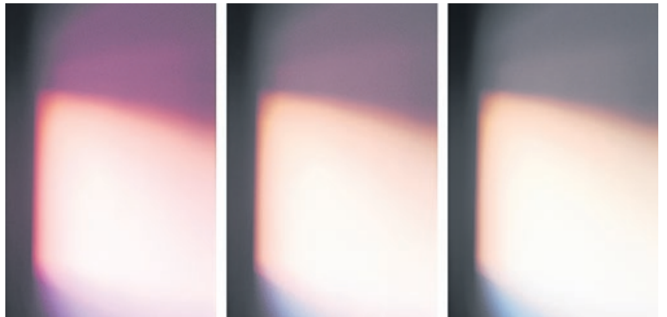
'Kosmos'. Fotogrames del vídeo Kosmos (2017), un treball fotogràfic sobre la llum i les ombres.