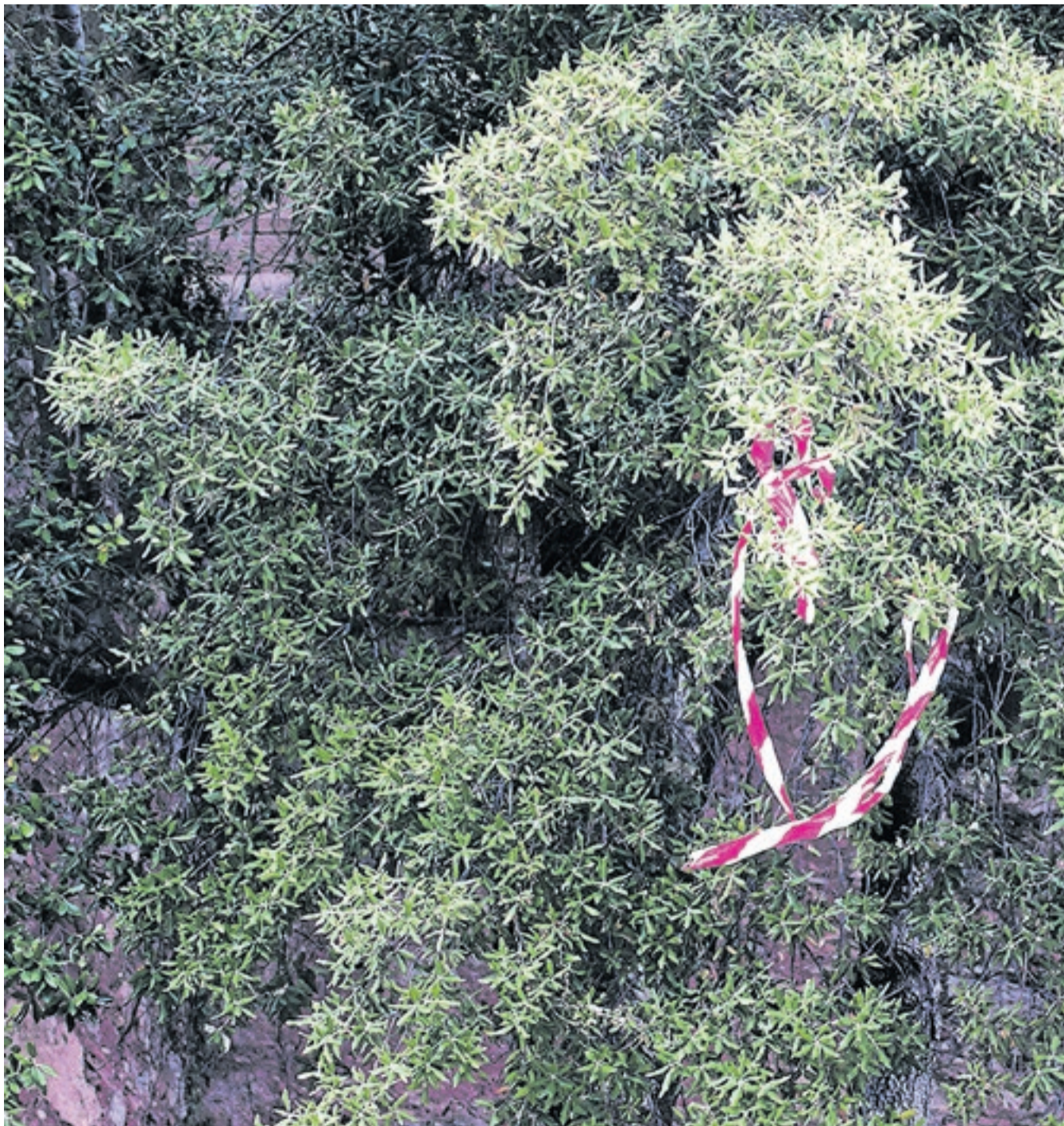
Un moment sí, més temps no. L'autora qüestiona la dinàmica reguladora que condiciona l'experiència de deambular per Montserrat.

Des de la sectorial de comarques de muntanya d'ASAJA de Lleida tornem a dir i ens referim que la convivència amb l'ós bru és inviable i que si volem que els nostres joves es continuïn quedant al territori i evitar el despoblament rural han de poder portar a terme la feina de la ramaderia extensiva sense por de pujar a les muntanyes del Pirineu. ■