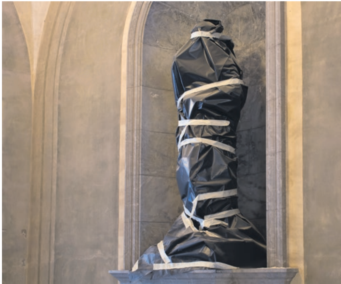
'Transgressions'. Fotograma del vídeo Transgressions (2019), projecte que busca la lentitud i la durada com a forma de resistència.

D'aquesta manera, sempre de la mà d'una brillantor expressiva poc discutible, Carlota Gurt crea un món decididament vindicatiu de la dona moderna. No va ser casual que en el seu discurs d'agraïment de la nit de Santa Llúcia l'autora recordés l'assaig de Virginia Woolf Una cambra pròpia . Potser Cavalcarem tota la nit seria justament això: la presentació d'un conjunt de vides, complex i divers, en veu d'una dona que ha trobat la seva pròpia cambra. ■