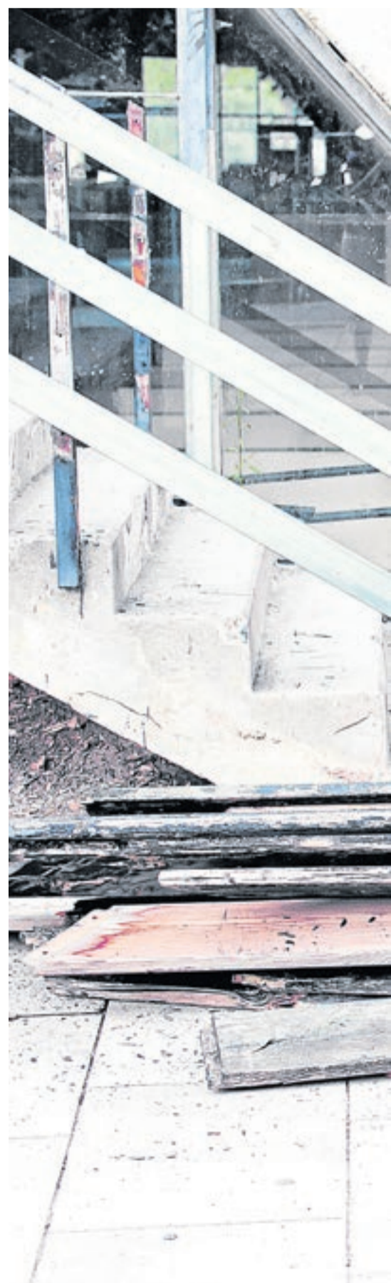
Decrepitud. El 2014 una estructura metàl·lica va substituir les deteriorades.

posen. Moviments i gestos de baix relleu –en alguns casos inadvertits– que fiquen en dubte el mateix mitjà fotogràfic, la percepció humana i el mateix acte de mirar. D'aquesta manera, en els seus projectes recents funcionen primordialment com a assajos conceptuals entorn del registre fotogràfic l'estat conscient dels entorns i l'exploració dels espais vitals. Constructes que cohabituen des del marge de la mirada i des de la invisibilitat com a matèria primera. ■