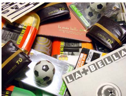
La Más Bella