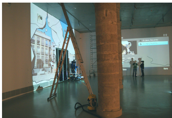
Muntatge de l'exposició A la derriba , de Juan López