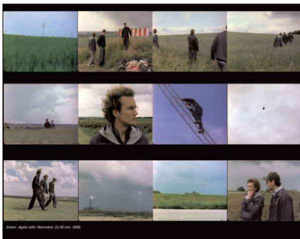
Pia Rönicke, The Zonen , 2005

Pia Rönicke s'ha interessat sempre pels projectes arquitectònics i pels sistemes utopistes. Le Corbusier, amb el seu model d'unitat d'habitatge i la derivació del seu projecte de ciutat-jardí, apareix constantment en la seva obra. El pas d'allò planejat a allò real es converteix en un tema cabdal en l'obra de Pia Rönicke. Treballant amb diferents formats, sigui vídeo, animació o instal·lació, Pia Rönicke ens parla del nostre entorn arquitectònic i de com el vivim com a individus.