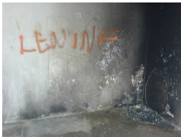
Dora García, CLL - Célule Cité Lénin, 2006

Dora García treballa amb projectes que impliquen la col·lectivitat. Diferents grups de persones han estat els destinataris directes i participants de les seves obres, en les quals barreja continguts narratius amb aproximacions a la quotidianitat. Situacions concretes es converteixen en mons particulars, en metàfores de possibilitats. La ficció i la fantasia, així com la cruesa de la realitat, van teixint els treballs en procés de Dora García.