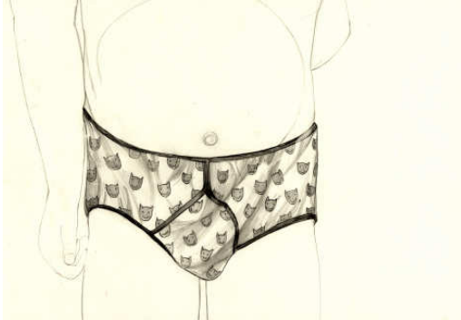
Marc Bauer, Constructing intimacy (hipòtesis II), 2003

l'aparador, en l'interior de l'experiència contemporània també és possible reconèixer una gestió de la transparència com a suport per legitimar un tipus d'exhibicionisme, una teatralització d'allò privat, ara descobert a la mirada col·lectiva, per repensar la mateixa idea de l'espectacular.