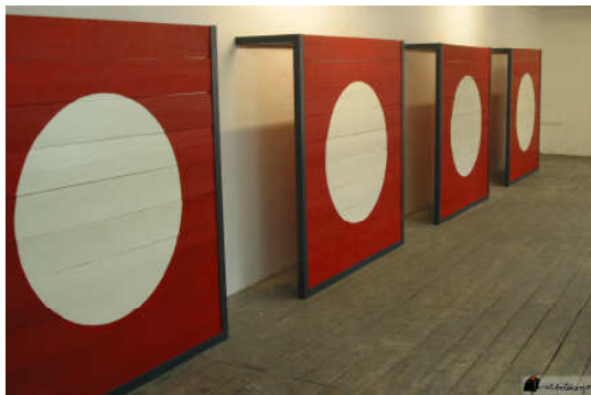
Fabrice Gygi, Protect Paint , 2005 Kültur Buró Barcelona y el artista

L'apologia moderna de la transparència molt aviat s'ha pervertit en un pretext per a la vigilància. Per a aquest lleu moviment només ha calgut reconvertir l'estructura d'un espai transparent en un dispositiu panòptic, on allò transparent alimenta la possibilitat d'una visió de control. La transparència es dilueix en la visibilitat i el visible esdevé l'escenari d'allò vigilat. Amb aquesta equació, legitimada per la suposada necessitat d'incrementar les mesures de seguretat, l'arquitectura pot tornar a solucions opaques amb pròtesis tecnològiques