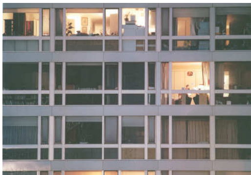
Ana Malagrida, S/T , 2002

L'arquitectura transparent contenia unes il·lusions de gran abast. D'alguna manera, la glaskultur pretenia operar com la pedrera de principis des dels quals crear solucions tipològiques per a les noves metròpolis. La realitat, però, ha estat ben diferent: l'arquitectura moderna desitjosa d'idear autèntiques «màquines d'habitar» ha estat el model amb què s'han resolt solucions matusseres per a la urbanització de la major part de les perifèries. L'arquitectura de la glaskultur sembla que ja només perviu a petita escala